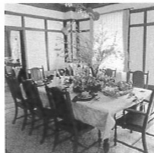
▲「ヨーロッパ」スタイル

メディカグループ（愛媛県松山市）は、家を建てたい人と建築家をつなぐ成果報酬制のマッチングサービス「HOUSE リサーチ 新築住宅情報センター」の運営を開始した。建築家（ハウスメーカー、工務店、設計